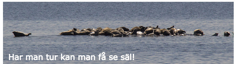
Har man tur kan man få se säl!